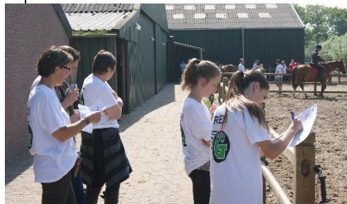
Vrijwilligers van de super G!

De workshop is alleen voor ruiters of ouders van ruiters die rijden of hebben gereden op de manege.